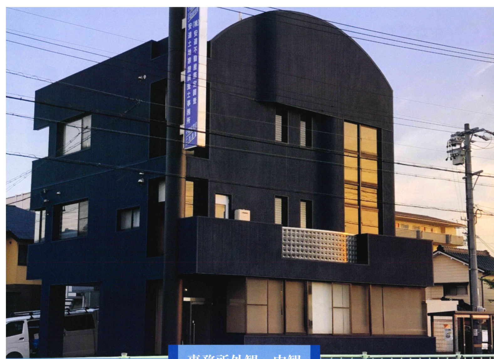
事務所外観・内観